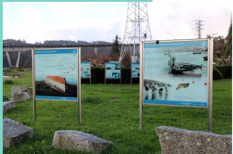
Área de interpretación das Saíñas, da Pasaxe e das embarcacións tradicionais