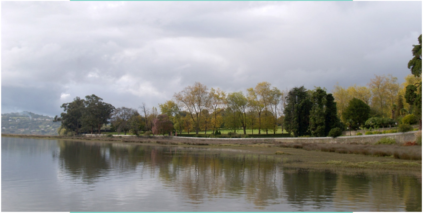
3-Pazo de Mariñán, á beira do esteiro do Mandeo. Acolle un Centro Cultural da Deputación de A Coruña. Nos xardíns, abertos ao público, conserva especies monumentais de numerosas árbores: camelias, buxos, plátanos, eucaliptos, chopos, freixo florido, pacana de illinois, palmeiras datileiras, érbedo, mirto, teixo... , algúns catalogados como especies senlleiras