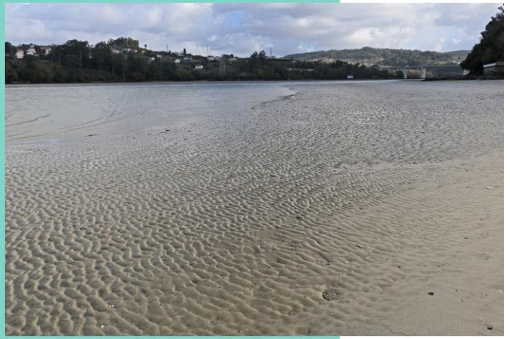
7-Praia da Cabana