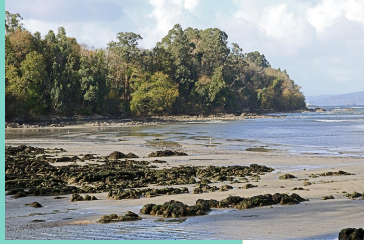
9-Punta de Moruxo. A Pedreira