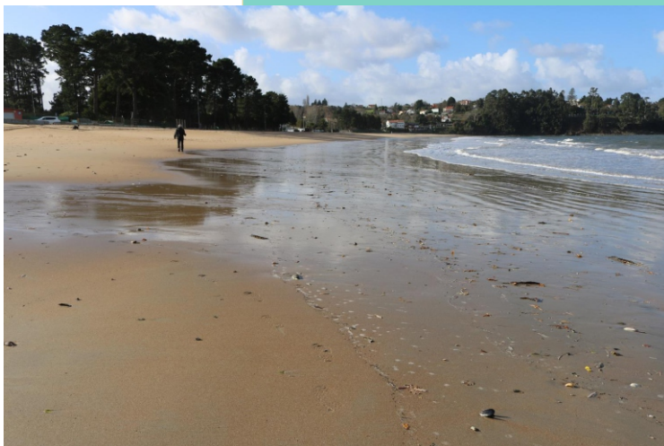
11-Praia de Gandarío. Un acolledor areal de 700 m de lonxitude.