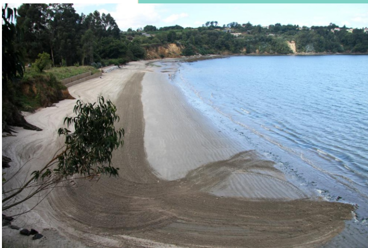
8-Praia do Regueiro/Moruxo