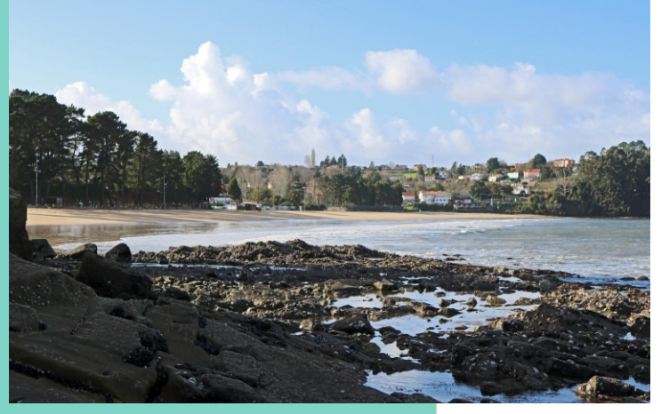
10-Punta de Gandarío