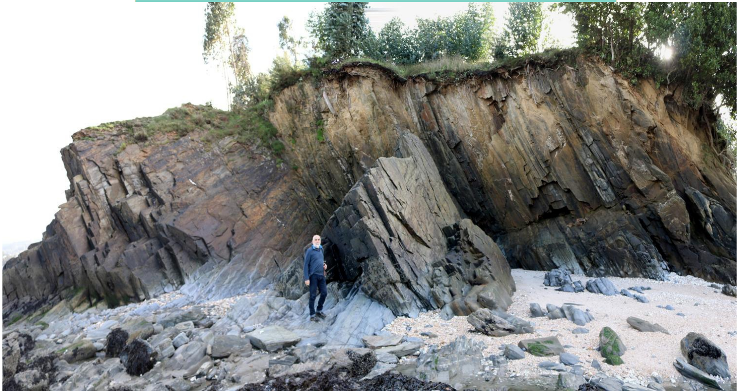
Cantil entre a praia da cabana e a praia do Regueiro/Moruxo